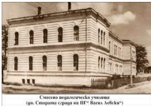
Смесено педагогическо училище (дн. Старата сграда на ПГ „Васил Левски”)